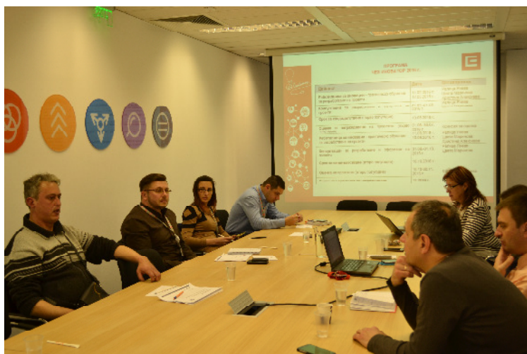
Среща на участниците в Клуб на иноватора – 28.01.2016 г.

В резултат на Проекта се учреди и своеобразен Клуб на иноватора в ЧЕЗ – членове са най-активните и креативни служители, участвали със свои проекти, както и представители на мениджмънта, които подкрепят реализирането им. Подобри се комуникацията между служителите и мениджмънта, родиха се нови идеи и бяха разработени още предложения. Сформираха се екипи от служители от различни отдели, дирекции, дружества – а разнообразието в опита, образованието и експертизата, са основа за създаване на иновации и гарант за техния успех.