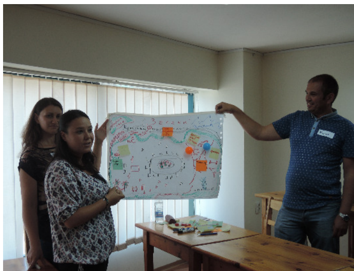
Участници в Работилници за иновации: 14.08.2015