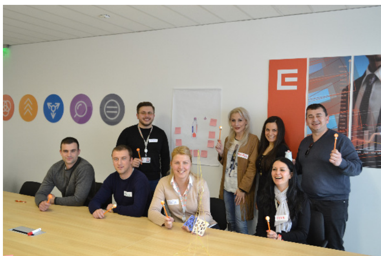
Участници в Работилници за иновации 11.02.2016г.

3) През 2016 г. Конкурса и всички планирани дейности отново бяха реализирани. Проведоха се 2 Работилници за иновации .